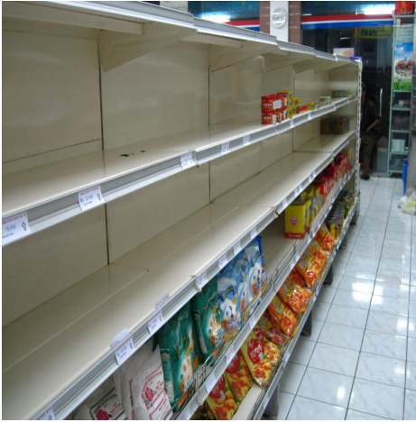
<사진3. 라벨링 미부착으로 압류된 사례1>

부터 ML 등록을 준비해 온 수입업체를 제외하고는 매출이 크게 줄어 대 사관에 통해 대책을 호소하기도 하였음