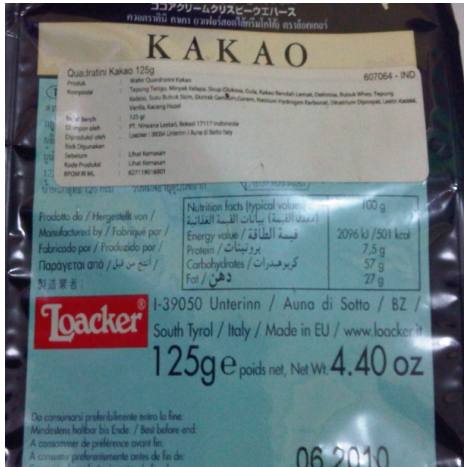
<사진1. 타국산 수입식품 라벨링>

않을 경우 세관에 계속해서 식품이 정척되게끔 하여 해당 업체는 변질 및 유통기한의 문제로 어쩔 수 없이 이들의 요구를 들어주곤 하였음. 이나마도 6개월에서 1년에 한 번씩 자주 담당이 바뀌어 해당 세관원 한두 명만을 매수해서 해결된 문제는 아님