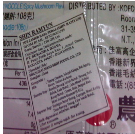
<사진2. 한국 수입식품 라벨링>