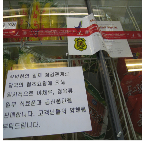
<사진4. 라벨링 미부착으로 압류된 사례2>