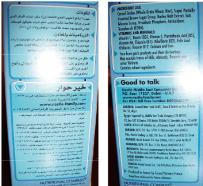
<네슬레 시리얼의 옆면-아랍어와 영문으로 모두 표기>