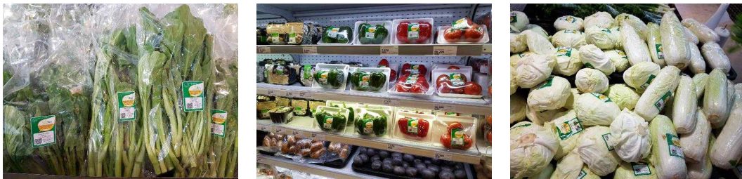
<VinMart에 진열돼 있는 VinEco 브랜드 상품>