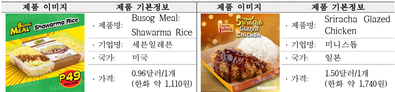
〈표 II-1〉 필리핀 편의점의 인기제품 기본정보

* 출처: 필리핀 세븐일레븐(www.7-eleven.com.ph), 필리핀 미니스톱(www.ministop.com.ph)