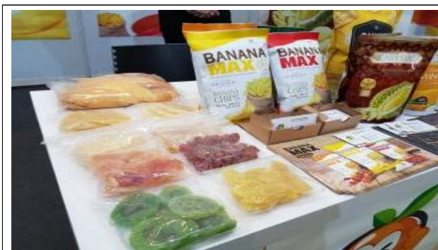
주요품목 : 건과일