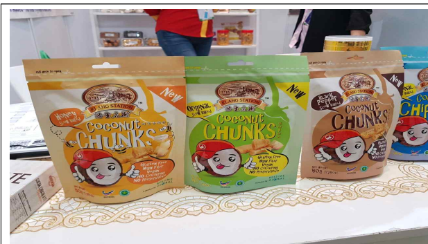
주요 품목: 코코넛 제품