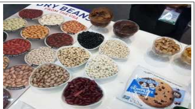
주요 품목 : 건두(頭)류