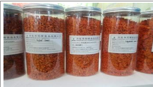
주요 품목: 건조 식품