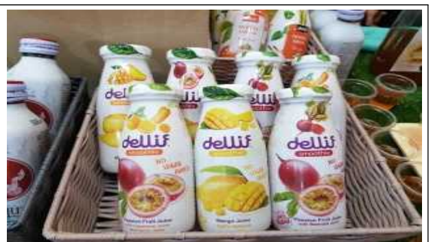
주요품목 : 견과류 가공품