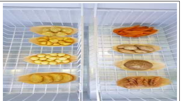
주요품목 : 감자 제품