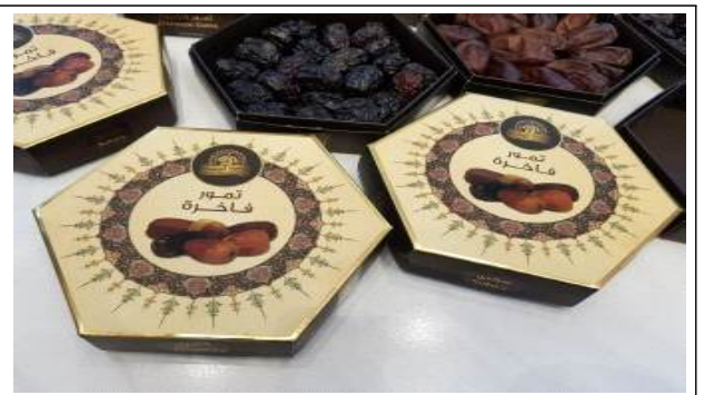
주요품목 : 대추야자