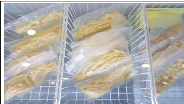
주요품목 : 감자튀김