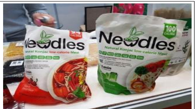
주요 품목 : 곤약 누들