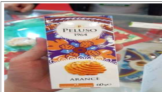
주요 품목: 비스킷