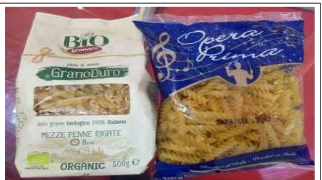
주요 품목: 파스타