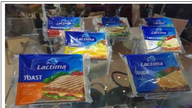
주요품목 : 치즈