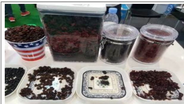
주요 품목: 베리(Berry) 제품