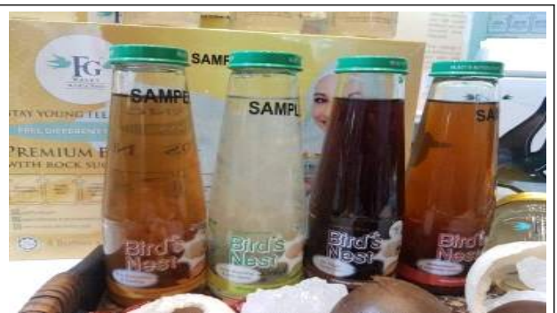
주요 품목 : 제비집 제품