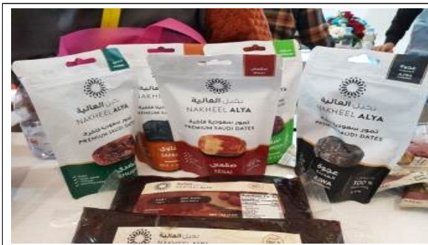
주요품목 : 대추야자