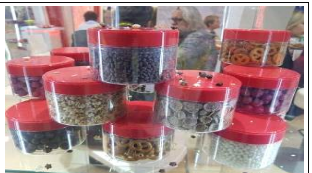
주요 품목 : 토핑용 스낵