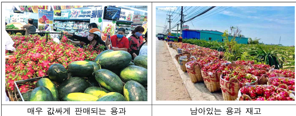
매우 값싸게 판매되는 용과