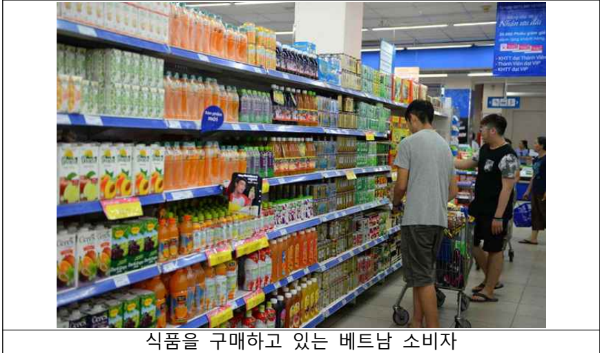
식품을 구매하고 있는 베트남 소비자