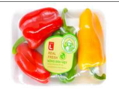
롯데마트 판매 현황