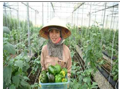
파프리카 재배 하우스