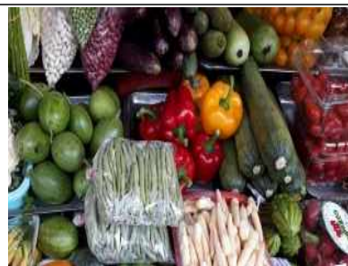
재래시장 판매 현황