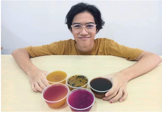
▲ lydid Aman와 콤부차 젤리