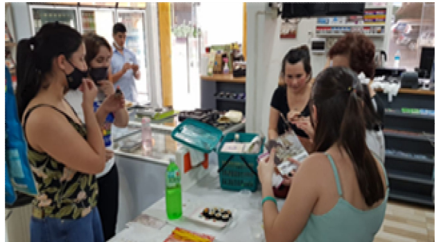
김밥 요리 시연