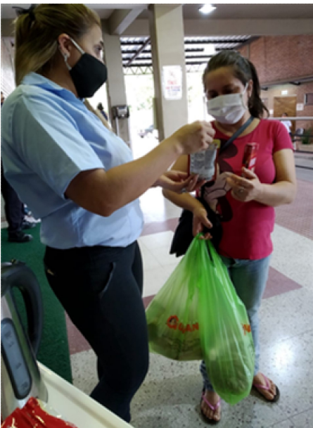
SUPERMERCADO GUARANI 판촉