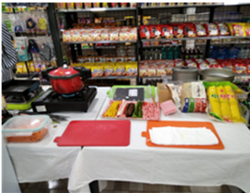
김밥 요리 시연