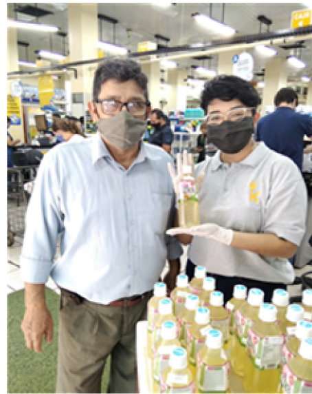
판촉 GRANVIA CENTRO