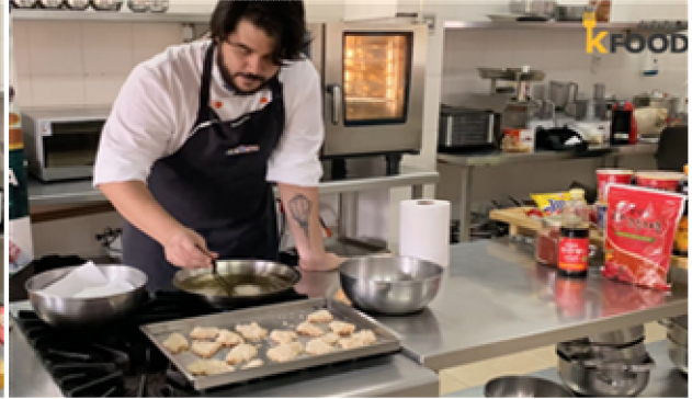
IGA 요리 동영상 제작