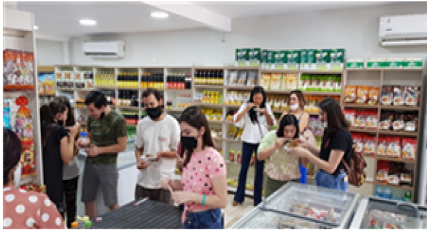
요리 시연 (당면)