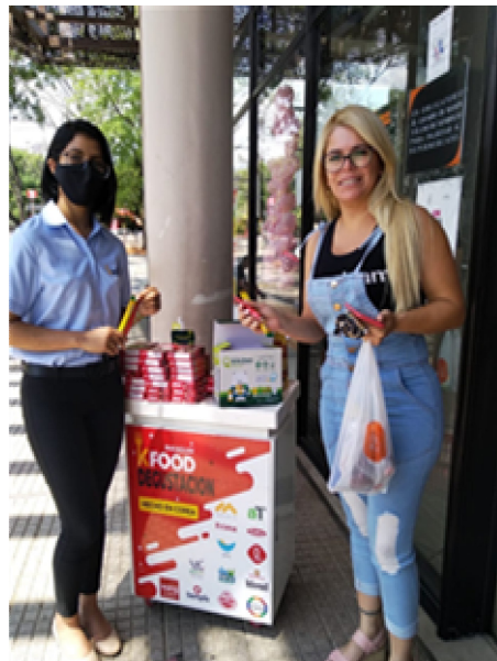
SUPERMERCADO VILLA SOFIA 판촉