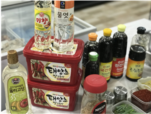
요리 시연 (제육볶음)