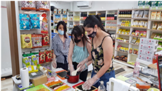
김밥 요리 시연