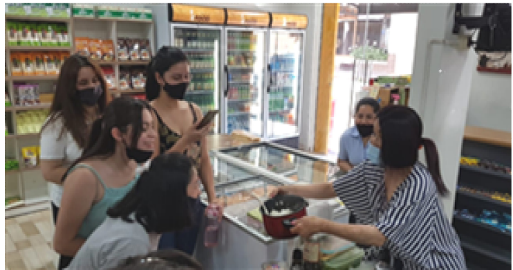
김밥 요리 시연