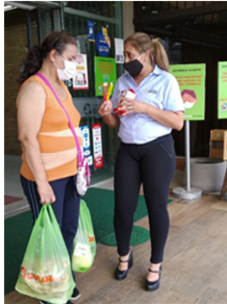
SUPERMERCADO GUARANI 판촉