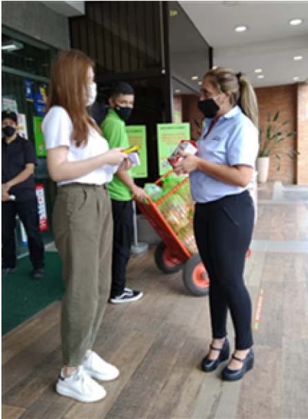
SUPERMERCADO GUARANI 판촉