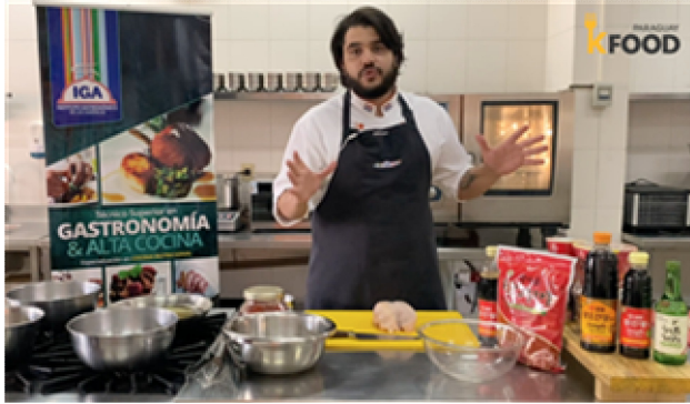
IGA 요리 동영상 제작