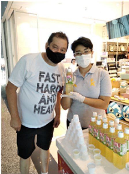
판촉 Miniso(Shopping Paris)