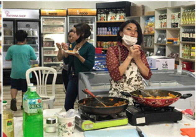
요리 시연 (떡볶이)