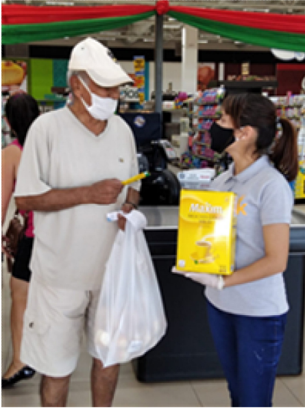
판촉 GRANVIA SAN JOSE