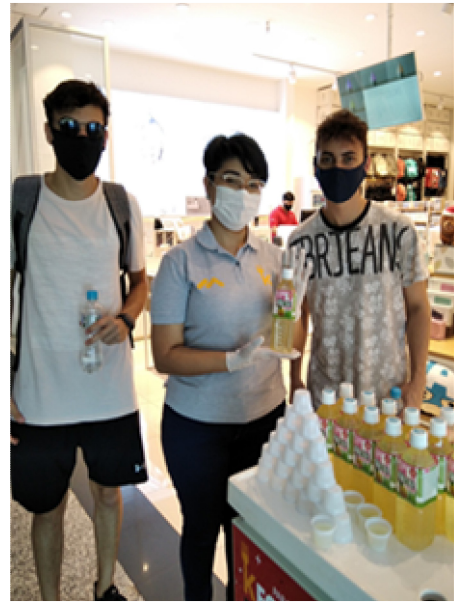
판촉 Miniso(Shopping Paris)