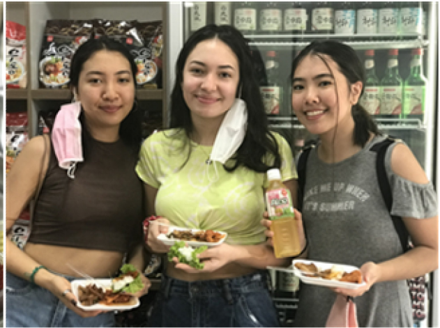
요리 시연 (제육볶음)