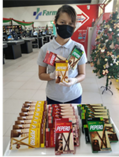
판촉 GRANVIA SAN JOSE