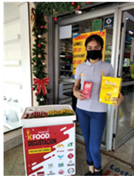
판촉 GRANVIA REMANCITO