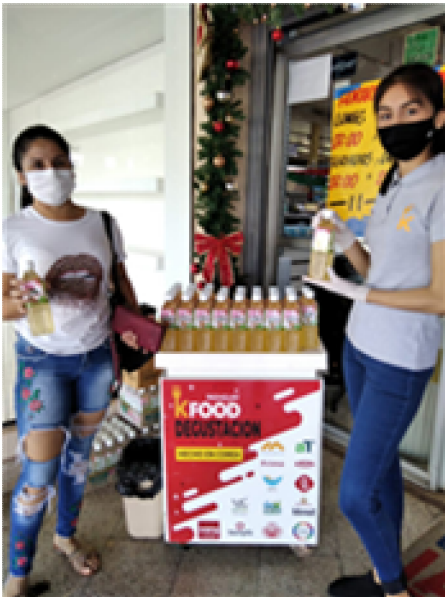
판촉 GRANVIA REMANCITO