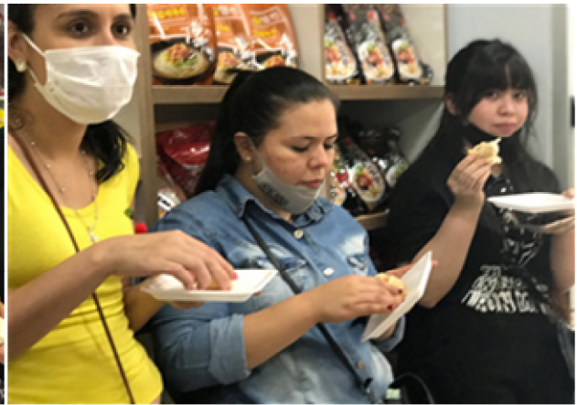
요리 시연 (불고기)