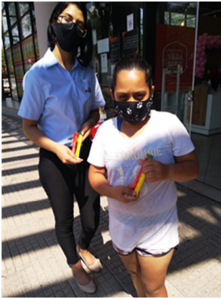
SUPERMERCADO VILLA SOFIA 판촉