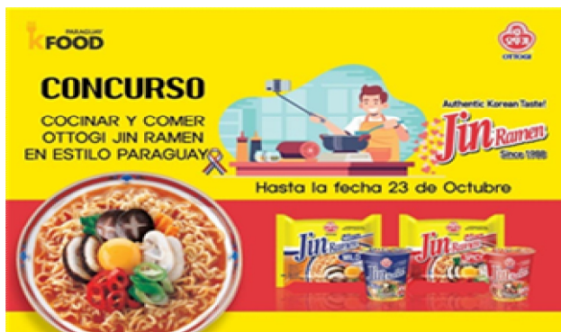
라면 동영상 제작