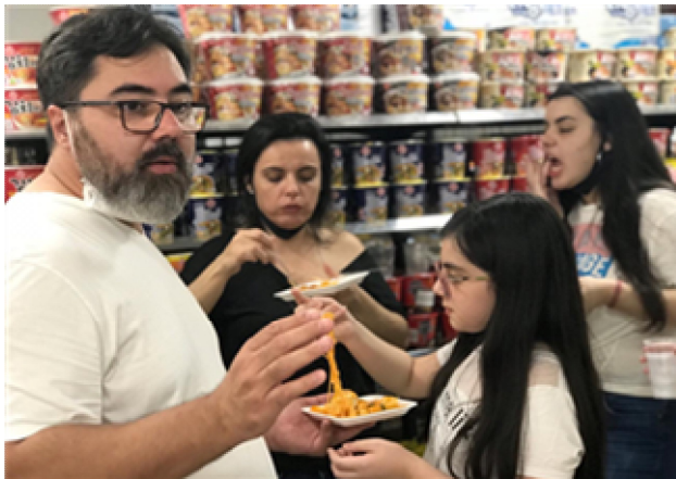
요리 시연 (떡볶이)