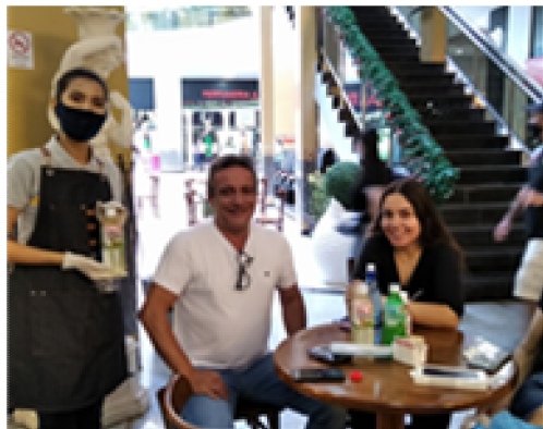
판촉 CAFE BONJOUR