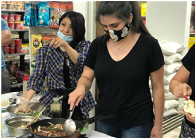
요리 시연 (불고기)