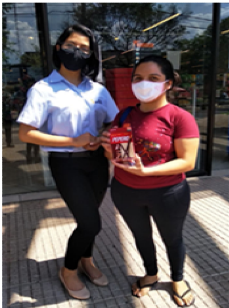
SUPERMERCADO VILLA SOFIA 판촉