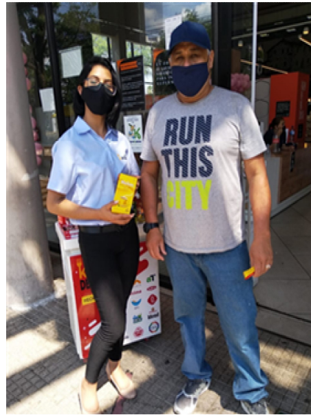
SUPERMERCADO VILLA SOFIA 판촉