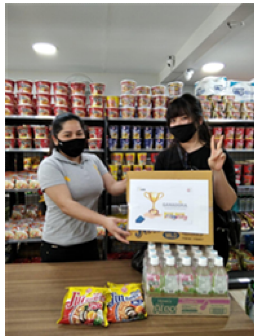
라면 동영상 제작