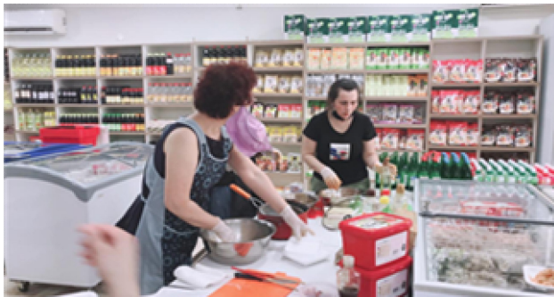
요리 시연(소면 국수)