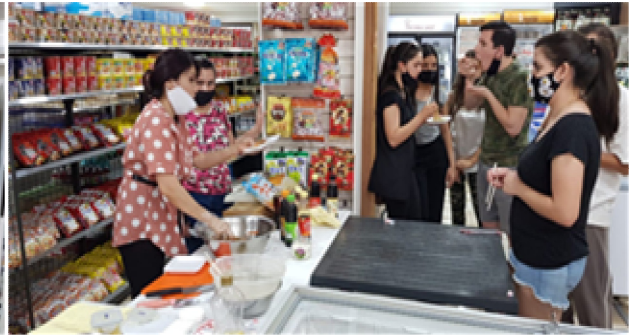
요리 시연 (당면)