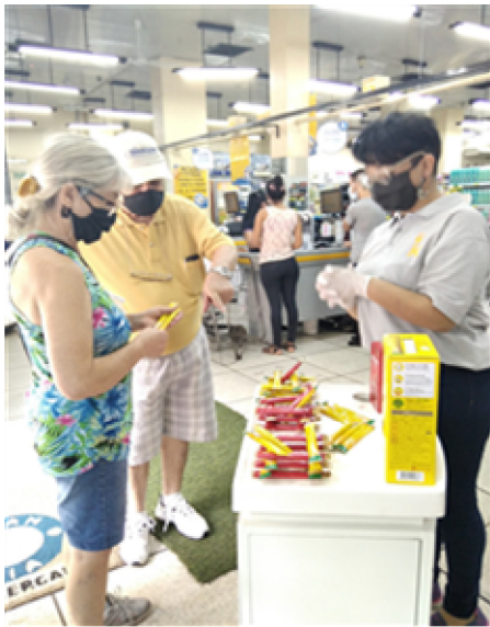
판촉 GRANVIA CENTRO