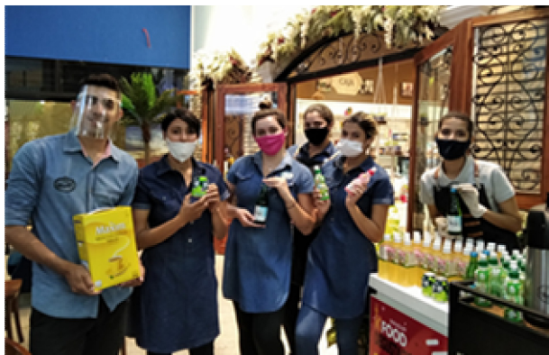
판촉 CAFE BONJOUR