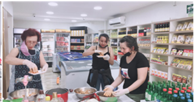
요리 시연(소면 국수)