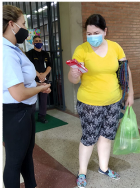
SUPERMERCADO GUARANI 판촉