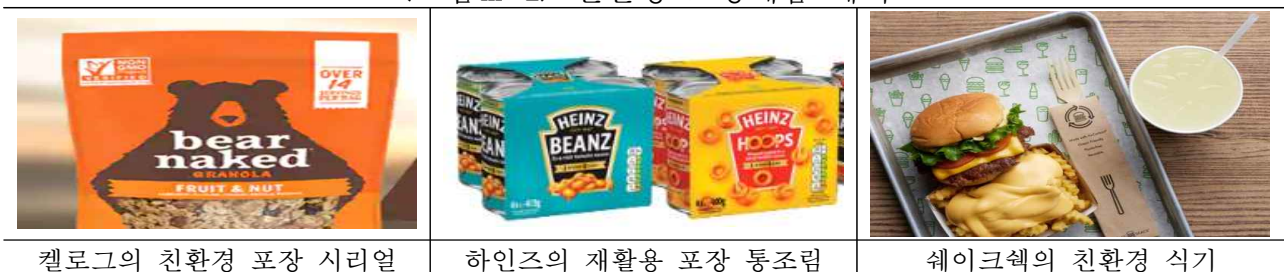
<그림 III-1> 친환경 포장제품 예시