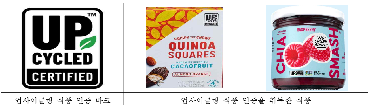
<그림 1-2> 업사이클링 식품 인증