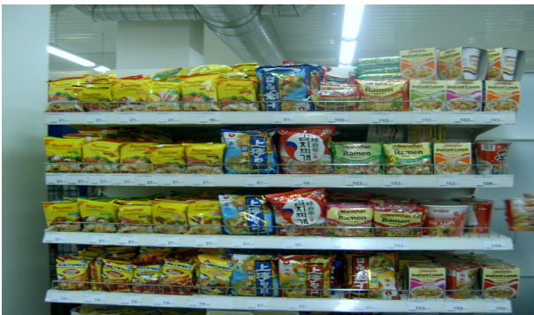
<알마티 SM수퍼마켓 라면매장>