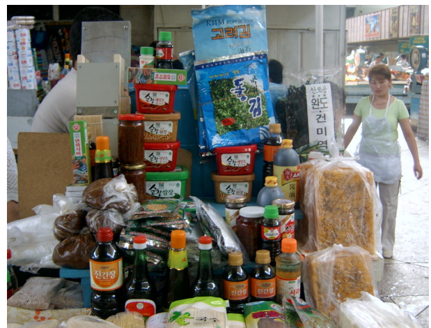
<재래시장의 한국산 장류>