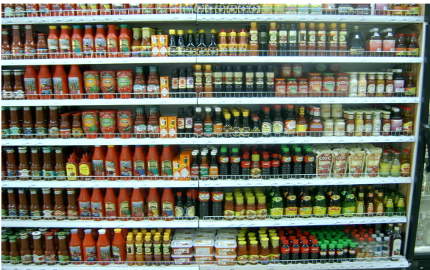
<알마티 SM 슈퍼마켓 소스매장>