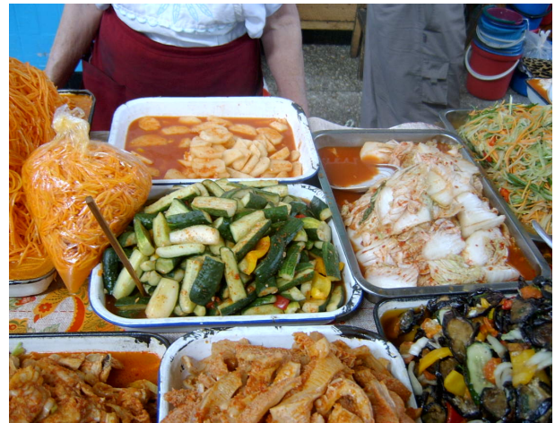
<재래시장 고려인 제조 김치>