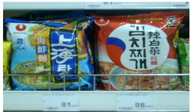
<중국에서 생산된 한국라면>