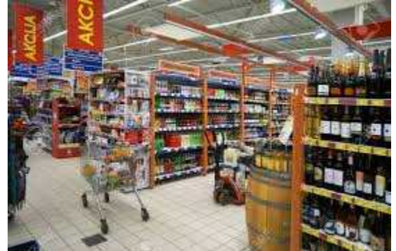
< 오프라인 판매 매장 >