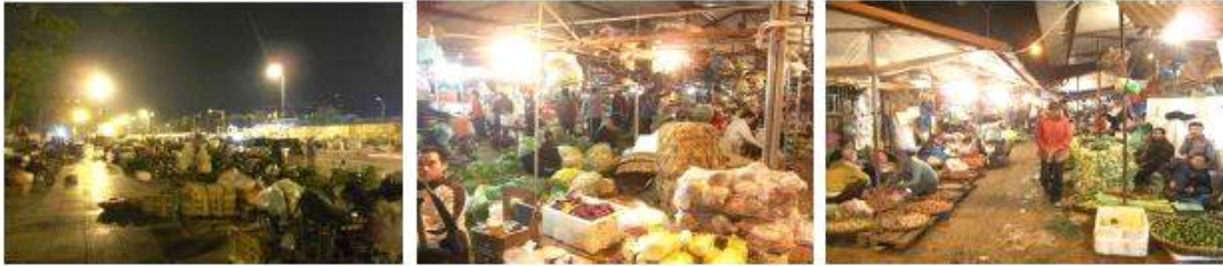
< Long Bien Market >

인근 Dong Xuan market과 Bac Qua market으로 옮기고 있음