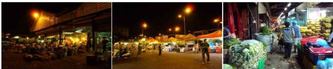
< Tam Bimh Market >