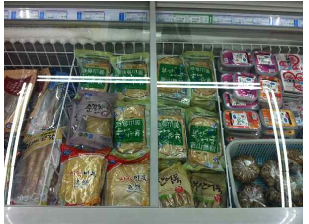
< 매장 내 어묵 판매대 전경 >