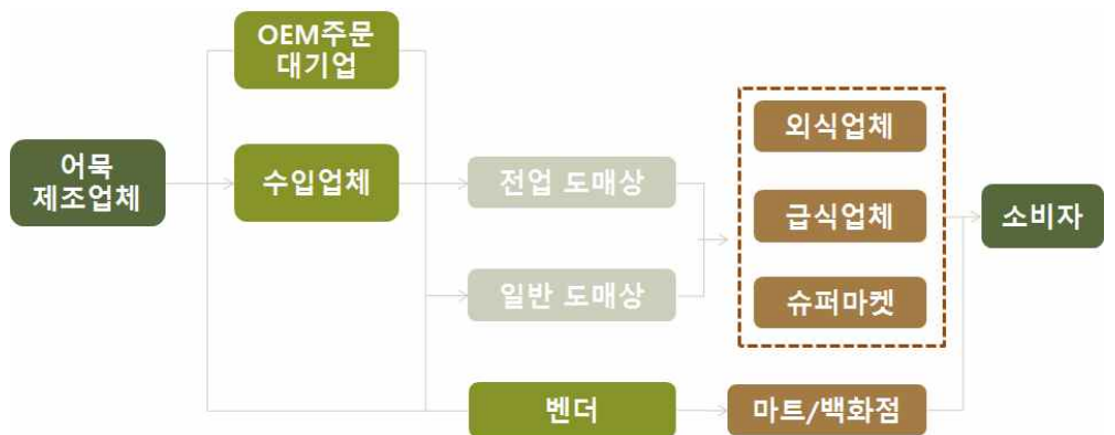
< 중국 어묵 유통구조도 >

중국인들의 삶이 고도화됨에 따라 슈퍼마켓, 하이퍼마켓과 같은 현대 유통채널이 재래 유통채널을 잠식하고 있으며 현재 전체 유통 규모의 약 60% 차지