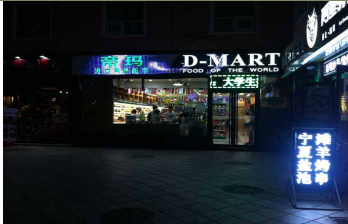
< 매장 전경 >