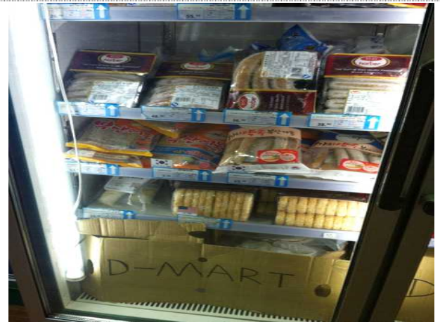
< 매장 내 어묵 판매대 전경 >