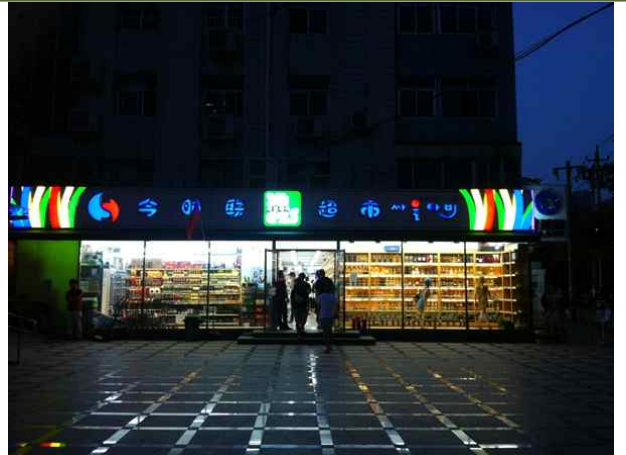
< 매장 전경 >