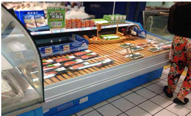
< 매장 전경 >