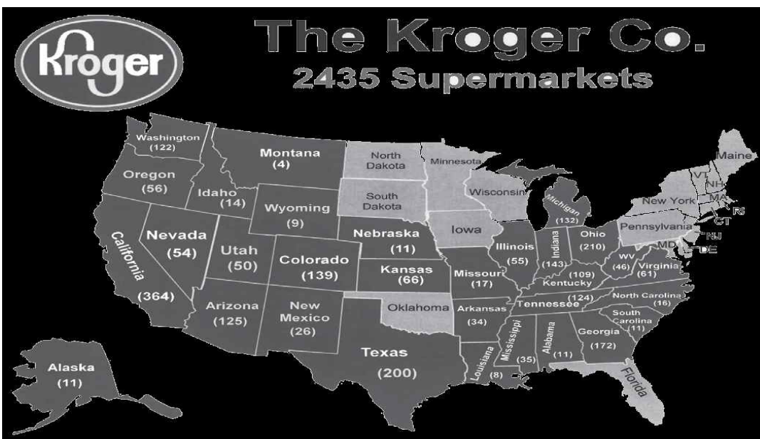
<표4> 크로거 지역별 슈퍼마켓 현황

크로거는 미국 내 구매의 경우 본사 제품개발부서에서 시장조사를 바탕으로 구매하는 것이 원칙이다. 지역별 매장 특성에 맞게 제품을 선택해야 하므로, 구매 결정권은 매장별 구매담당자가 직접 업체를 평가하고 선정하고 있다. 해외구입은 크로거 계열사인 프레드마이어의 상품개발수입부에 구매의뢰를 통해 이뤄지며 담당부서는 해외 에이전트를 통해 물건을 구매하게 된다. 크로거는 자체브랜드 상품을 개발하여 판매하므로 공급업체의 브랜드 인지도는 중요하지 않고 대신 좋은 품질의 제품을 얼마나 저렴하게 제공하느냐에 중점을 두고 있다.