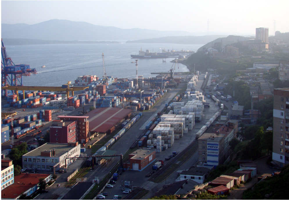
▮ The Commercial Port of Vladivostok ▮