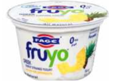
[ 요거트 ]

유제품을 전문적으로 수입, 유통하는 Optima Foods의 구매부 담당자에 따르면, 그리스에서 요거트 제품을 수입하고 있으나, 판매량이 지속적으로 하락하고 있다고 전했다. 미국 현지사람들에게 요구르트는 건강에 지나치게 관심이 있는 소비자들만이 구매하는 유제품으로 수요가 높지 않다고 설명했다. 자녀를 둔 주부만이 구매할 뿐 성인들이 즐겨 먹지는 않는다고 전했다. 미국의 요구르트 시장은 이미 포화상태라서 새로운 브랜드가 진입하여도 소비자들의 주목을 받지 못할 것으로 평가했다.