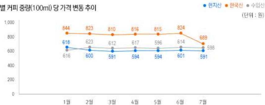
2) 원산지별 커피 중량(100ml) 당 가격 변동 추이