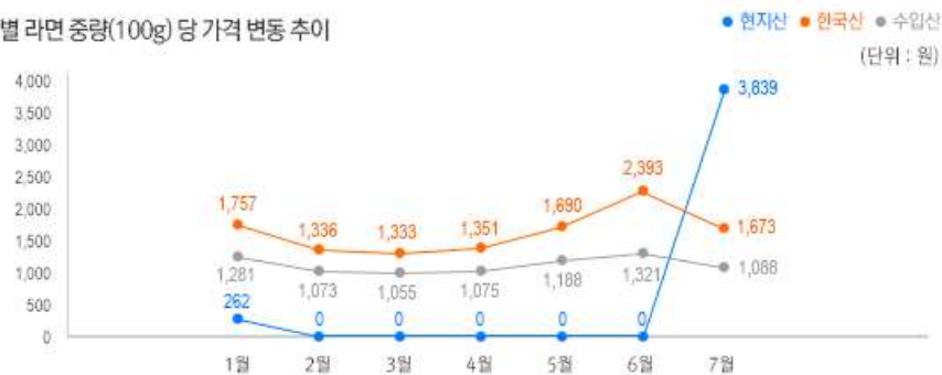
2) 원산지별 라면 중량(100g) 당 가격 변동 추이