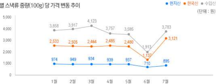
2) 원산지 별 스낵류 중량(100g) 당 가격 변동 추이