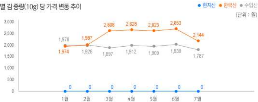
2) 원산지별 김 중량(10g) 당 가격변동 추이