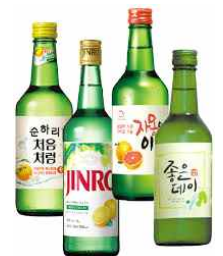
[ 한국산 소주 ]