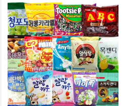
[ 한국산 사탕 ]