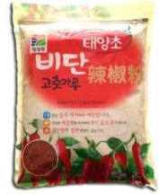
[ 고춧가루 ]