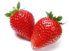
[ 신선과일 ]

수입 과일 및 채소를 전문적으로 수입·유통하는 업체인 Biovegi Vietnam Joint stock Company의 직원과의 인터뷰 결과, 한국산 배와 딸기의 판매량이 2017년 매달 증가추세임을 밝혔다. 해마다 오르고 있는 국민소득의 영향으로 베트남 소비자들이 먹거리에 지대한 관심도가 높아지고 있다고 전했다. 이에 사람들이 안전하고 신선도가 높은 좋은 품질의 과일이라 인식하는 수입산 과일의 판매량 증가로 연결되었다고 설명했다. 베트남 과일에 대한 낮은 신뢰도로 까다로운 검역을 거쳐 시장에 반입된 수입 과일에 대한 선호도가 월등히 높기 때문이라 덧붙여 설명했다. 특히, 딸기의 경우 지난 2016년부터 베트남으로 수출하기 시작했으나 현지에서의 반응이 긍정적인 것으로 드러나 당분간 해당 트렌드가 지속될 것으로 전망했다. 하지만, 사과, 배, 포도는 현지에서 경쟁이 치열한 품목이므로 품질 관리 혹은 가격 조정 등의 전략을 잘 유지하는 것이 중요하다고 전달했다.