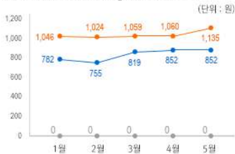
1) 원산지 별 라면 중량(100g) 당 가격 변동 추이