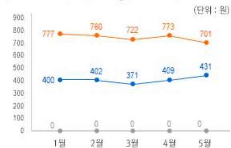
1) 원산지 별 장류 중량(100g) 당 가격 변동 추이