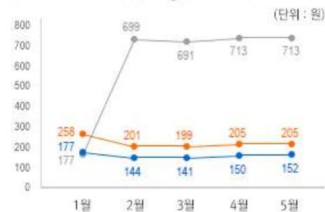
1) 원산지 별 스낵류 중량(10g) 당 가격 변동 추이