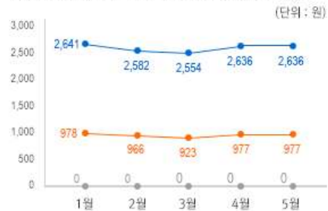
1) 원산지 별 민속주 중량(100ml) 당 가격 변동 추이