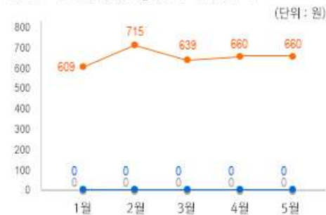
1) 원산지 별 김 중량(10g) 당 가격 변동 추이