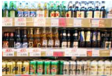
[일본 내 판매중인 수입맥주]

일본 내 수입 식품을 취급하는 라이프 마트는 할로윈 캠페인이라는 이름으로 식품 가격 프로모션을 실시하는데, 해외 맥주 3병을 구매할 경우 약간의 가격 할인 혜택을 제공한다. 1 병을 구매할 경우 248엔이지만 3병을 구매할 경우에는 698엔으로 주류 소비자는 46엔을 절약할 수 있다.