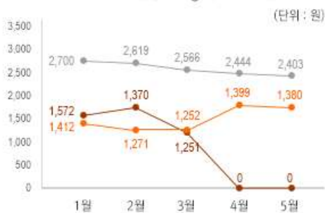
2) 원산지 별 비스킷류 중량(100g) 당 가격 변동 추이