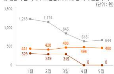
2) 원산지 별 과채 주스 중량(100ml) 당 가격 변동 추이