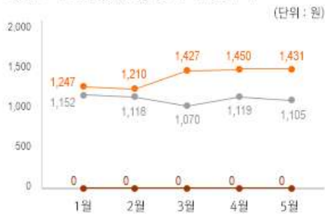
2) 원산지 별 김 중량(10g) 당 가격 변동 추이