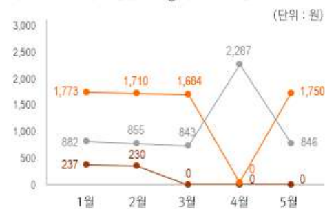
2) 원산지 별 장류 중량(100g) 당 가격 변동 추이