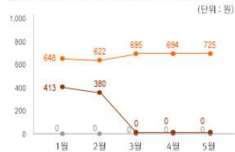
2) 원산지 별 소주 중량(100ml) 당 가격 변동 추이