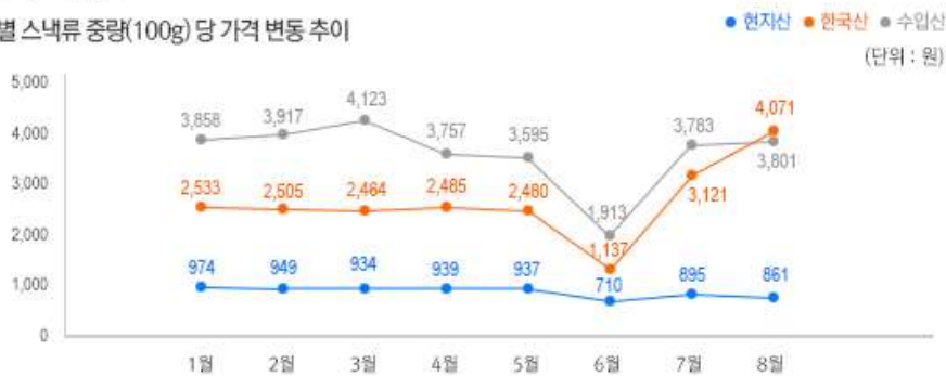
2) 원산지 별 스낵류 중량(100g) 당 가격 변동 추이