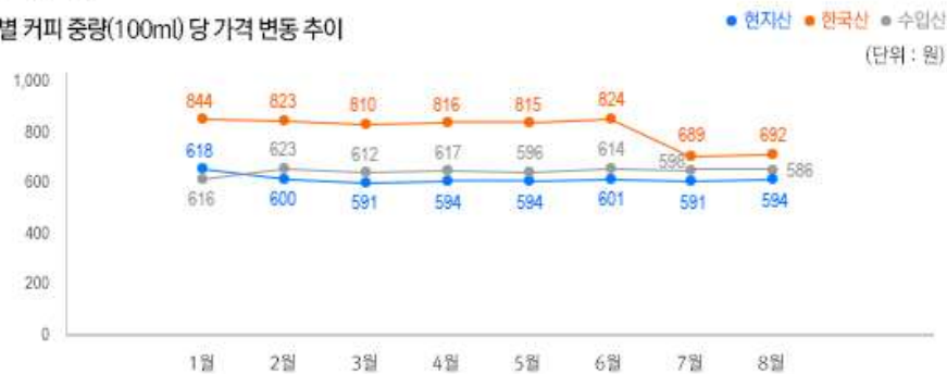
2) 원산지 별 커피 중량(100ml) 당 가격 변동 추이