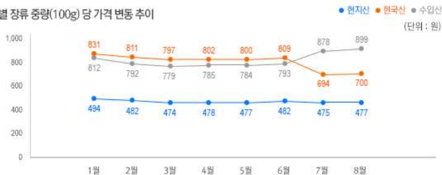
2) 원산지 별 장류 중량(100g) 당 가격 변동 추이