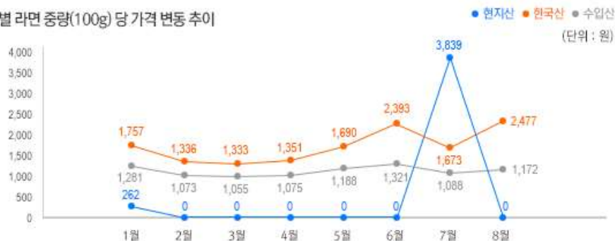
2) 원산지 별 라면 중량(100g) 당 가격 변동 추이

※ 미국 달러의 경우 원화 환산 시 KEB하나은행 8월 29일자 기준으로 작성. 1달러 = 1,126.40 원