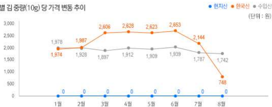
2) 원산지 별 김 중량(10g) 당 가격 변동 추이