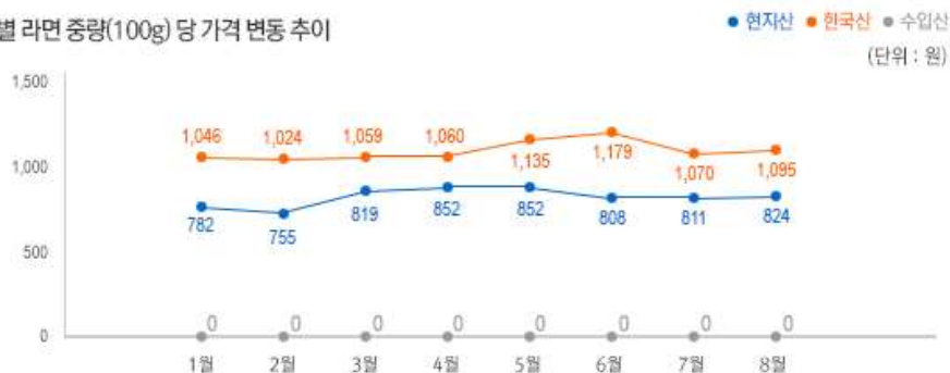
2) 원산지 별 라면 중량(100g) 당 가격 변동 추이