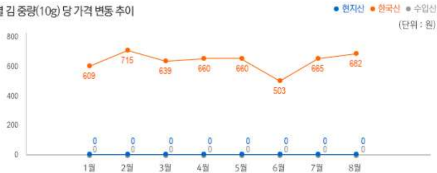
2) 원산지 별 김 중량(10g) 당 가격 변동 추이