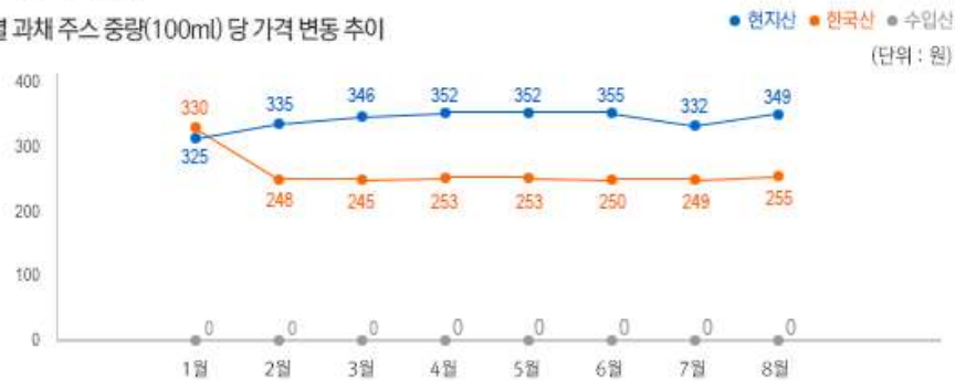
2) 원산지 별 과채 주스 중량(100ml) 당 가격 변동 추이