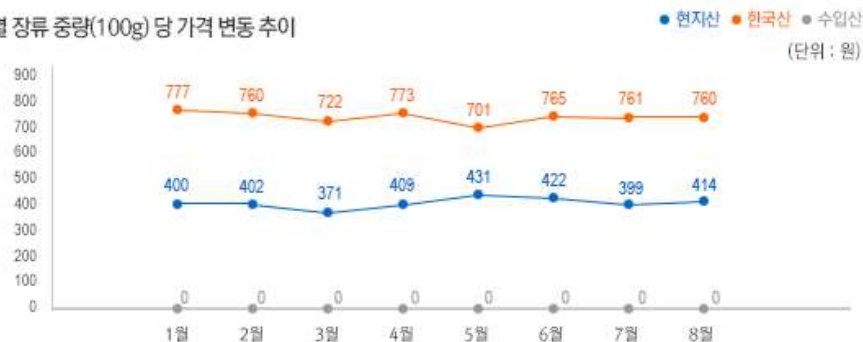
2) 원산지 별 장류 중량(100g) 당 가격 변동 추이