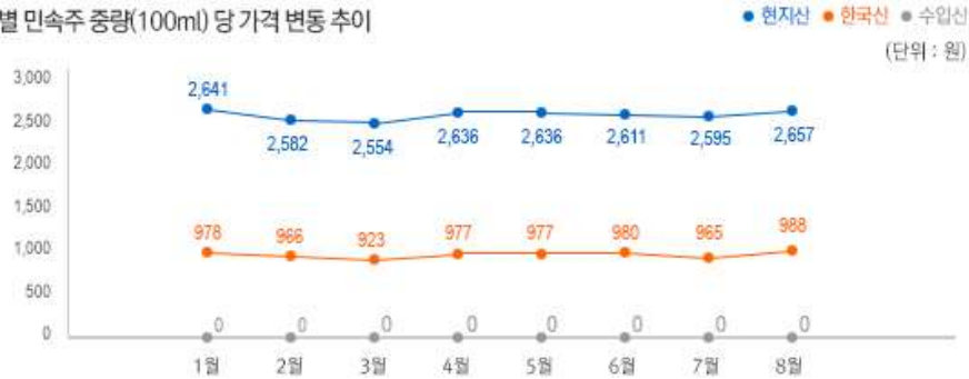
2) 원산지 별 민속주 중량(100ml) 당 가격 변동 추이