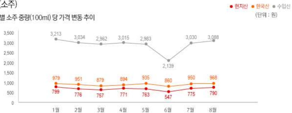
2) 원산지 별 소주 중량(100ml) 당 가격 변동 추이