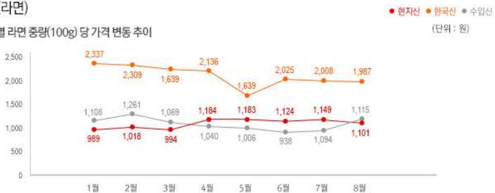
2) 원산지 별 라면 중량(100g) 당 가격 변동 추이