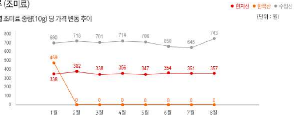
2) 원산지 별 조미료 중량(10g) 당 가격 변동 추이