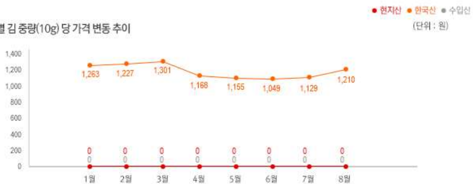
2) 원산지 별 김 중량(10g) 당 가격 변동 추이