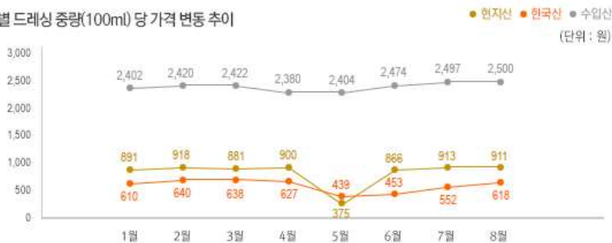
2) 원산지 별 드레싱 중량(100ml) 당 가격 변동 추이

※ 호주 달러의 경우 원화 환산 시 KEB하나은행 8월 25일자 기준으로 작성. 1달러 = 891.96 원