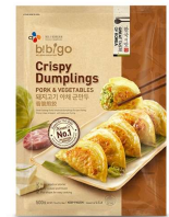
[돼지고기 야채 만두]