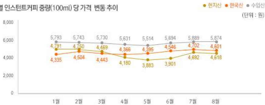
2) 원산지 별 인스턴트커피 중량(100ml) 당 가격 변동 추이