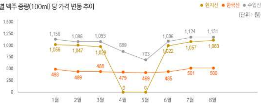
2) 원산지 별 맥주 중량(100ml) 당 가격 변동 추이