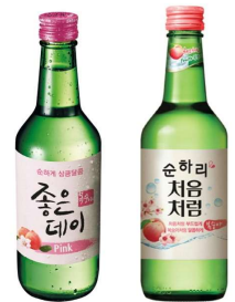
[한국 복숭아 맛 소주]

한국, 일본 주류 제품 전문 수입·유통업체 Lion Oriental Foods Co.의 담당자의 인터뷰에 따르면, 한국산 복숭아 맛 소주와 유자 맛 소주의 판매량이 가장 높다고 전했다. 한국 소주의 경우 향이 강해 호불호가 극명하게 갈릴 수 있지만 과일 맛 소주는 특정 과일이 첨가되어 맛과 향이 균형을 이루기 때문에 특히 복숭아와 유자 맛은 여성 구매자들이 선호하는 제품이라고 설명했다. 당사에서는 막걸리도 취급하고 있지만 소비자들의 다양한 취향을 바탕으로 선호하는 제품을 고를 수 있는 소주의 수요가 월등히 높은 편이라고 덧붙였다.