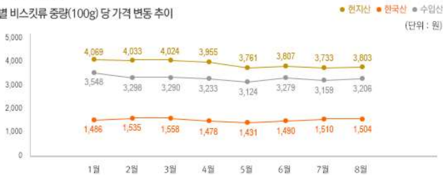
2) 원산지 별 비스킷류 중량(100g) 당 가격 변동 추이