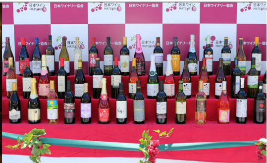
일본 와인마츠리 수상 와인

* 출처 : 일본 와이너리 협회 http://www.winery.or.jp