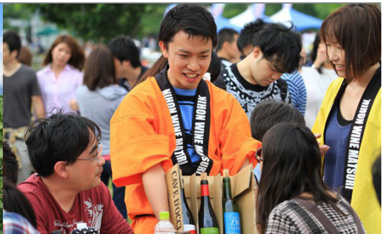
일본 와인마츠리 2016(도쿄)