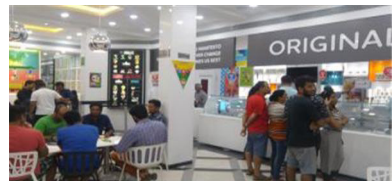
Natural Icecream(내추럴 아이스크림) 매장 전경