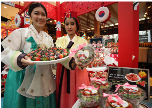
발렌타인데이 연계 딸기 판촉