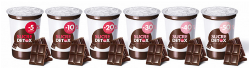
| 6단계 설탕 디톡스 디저트 |