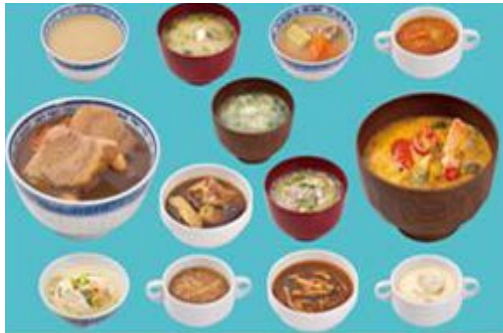
홍콩 대중음식점에서 시판되는 스프의 종류