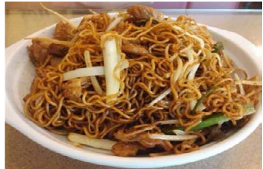
홍콩 즉석라면 토핑 활용 예시