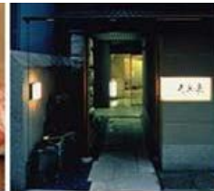
고급스시와 일식 레스토랑