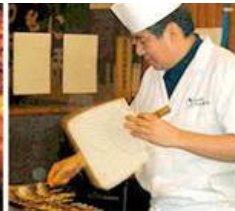
여름철 보양식 장어구이