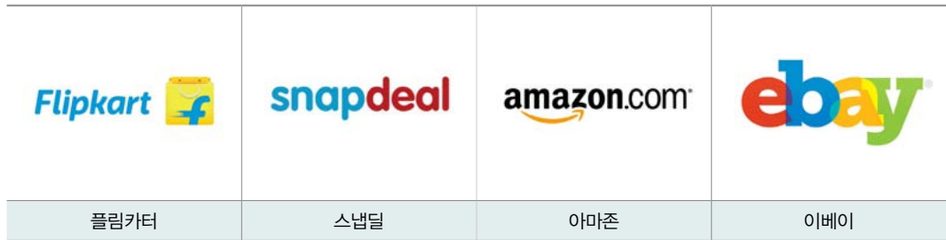
| 인도 온라인 시장 선도 기업들 |