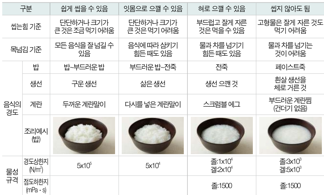
| 일본 유니버설 디자인 푸드의 규격 |