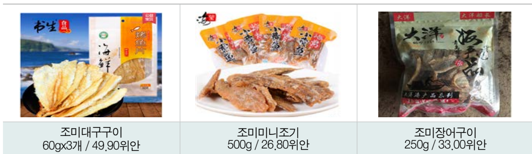
| 중국산 수산물 간식 |