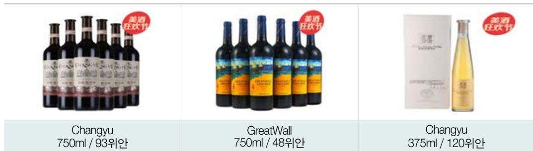
| 중국산 와인 인기 판매 제품 |