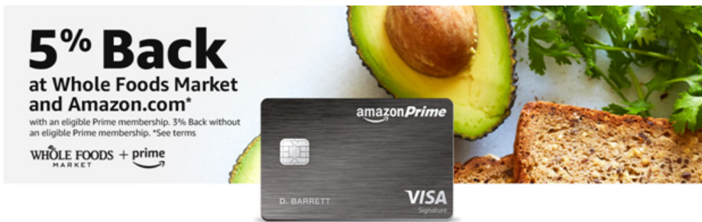
* 사진출처 : 아마존닷컴 홈페이지(www.amazon.com)