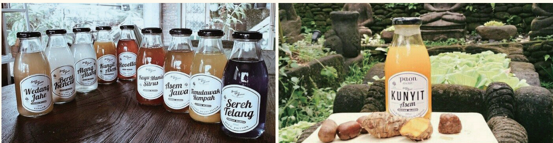
수웨오라자무의 '자무' 음료들

친환경 식당들이 대부분 서양화된 메뉴를 제공하는데 반해, 이곳은 인도네시아 전통음식과 음료를 메뉴로 제공한다. 한약을 담은 인도네시아 전통건강음료인 자무(Jamu)를 판매하며, 2013년 설립 이후 현재 자카르타에 총 3곳의 매장을 운영 중이다.