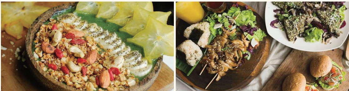
버그린스의 비건 햄버거와 기타 메뉴들

2013년 젊은 채식주의자 부부가 소박하게 시작한 채식 기반 오거닉 레스토랑으로, 가장 유명한 비건식당 중 한 곳이다. 다양한 채식 햄버거 메뉴를 자랑하며, 총 3곳의 매장을 운영 중이다. 친환경 세미나와 환경보호 캠페인 등 녹색소비촉진 활동과 채식에 대한 홍보를 활발히 진행하고 있다.