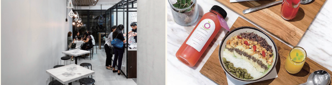
베리웰 자카르타지점 매장 모습과 냉압착 주스

2015년 인도네시아에 설립된 천연주스 및 디저트체인으로, 인도네시아 로컬식재료를 원료로 사용해 신선한 건강스무디와 냉압착주스를 주 메뉴로 제공한다. 자카르타에 총 3곳의 매장이 있다.