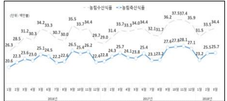
<참고3> 최근 3개년 일별 수출추이