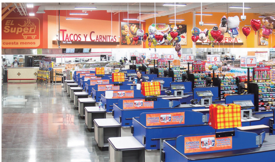
| El Super |