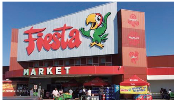
| Fiesta Market |