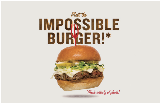
Fatburger의 Impossible burger