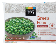
Whole Foods Market