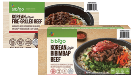
비비고에서 출시한 냉동 비빔밥