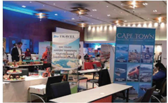
2018 Africa Halal Week에서 할랄관광 전시 부스