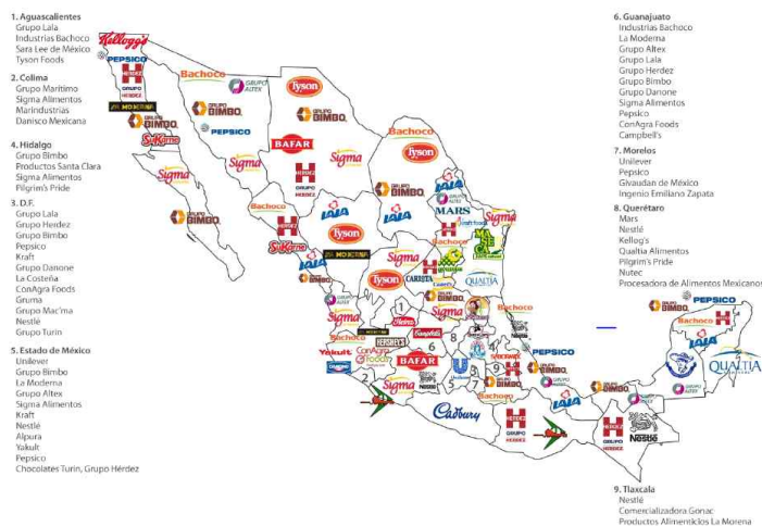
멕시코 내 주요 포장식품 진출 회사 현황