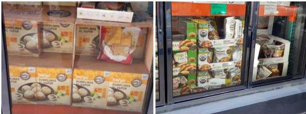
Costco에서 판매중인 한국산 즉석 만두