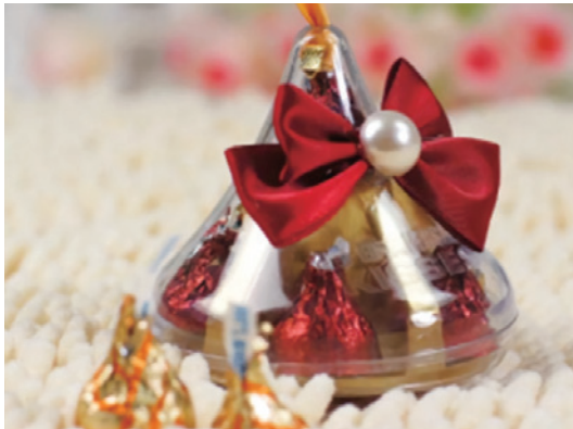
| 허쉬의 시탕 포장 |