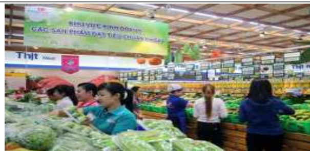
Coopmart VietGAP 야채 코너