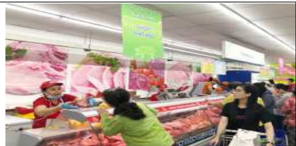
Coopmart VietGap 축산 코너