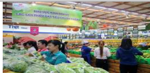
Coopmart VietGap 야채 코너