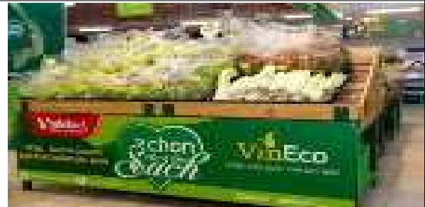
Vinmart 내 야채코너