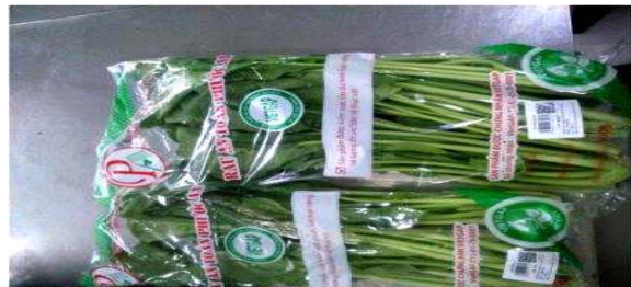
마크 부착 예시