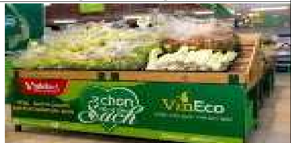
Vinmart 내 야채코너