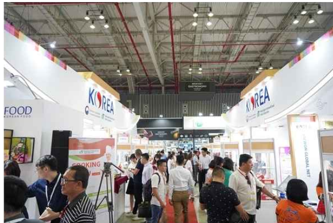
출처 : 4월 24일~26일 호치민시에서 열린 2019 베트남 식품박람회