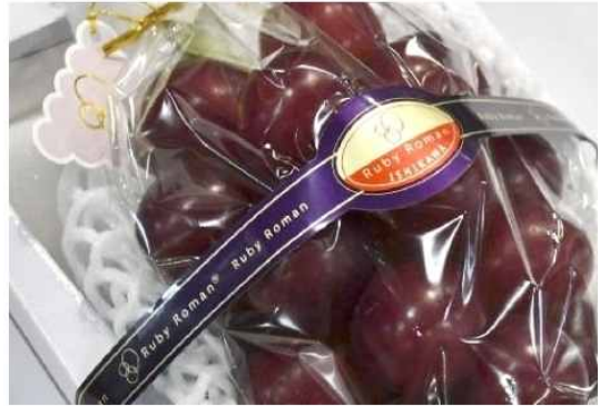
출처 : 부처 모양 배.(사진=프루트 몰드 컴퍼니) / 한송이 1100만원 루비 로만 포도