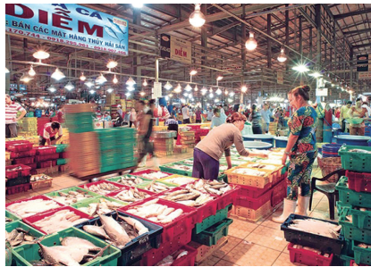
▲ 빈디엔 도매시장