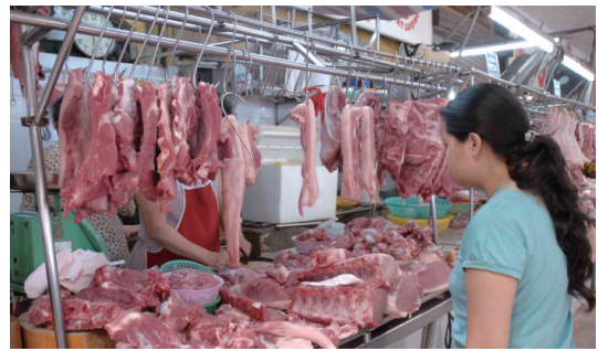
▲ 흑몬 도매시장의 돼지고기 판매