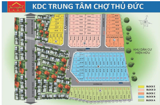
▲ 투득 도매시장 구조