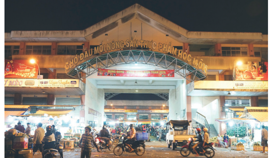
▲ 흑몬 도매시장

호치민시에 돼지고기를 가장 많이 공급하는 시장으로 잘 알려져 있으며 일평균 5천마리의 돼지를 공급하고 있다.(전체 시장점유율 중 50~55% 차지) 냉동육은 판매하지 않고 있으며, 당일 소진을 원칙으로 한다.