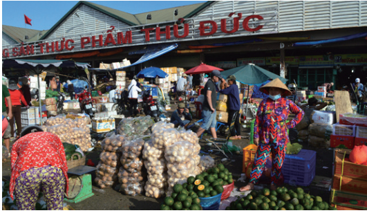
▲ 투득 도매시장